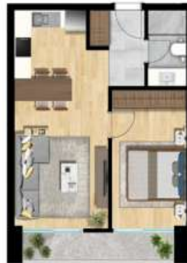
1+1 TİP 2 A BLOK