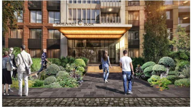
AVRUPA KONUTLARI SAKLIVADI PROJESI