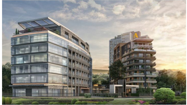
AVRUPA KONUTLARI SAKLIVADI PROJESI