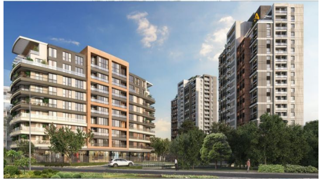
AVRUPA KONUTLARI SAKLIVADI PROJESI