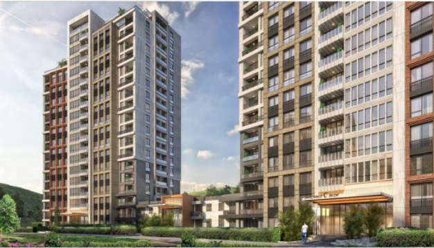
AVRUPA KONUTLARI SAKLIVADI PROJESI