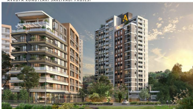
AVRUPA KONUTLARI SAKLIVADI PROJESI