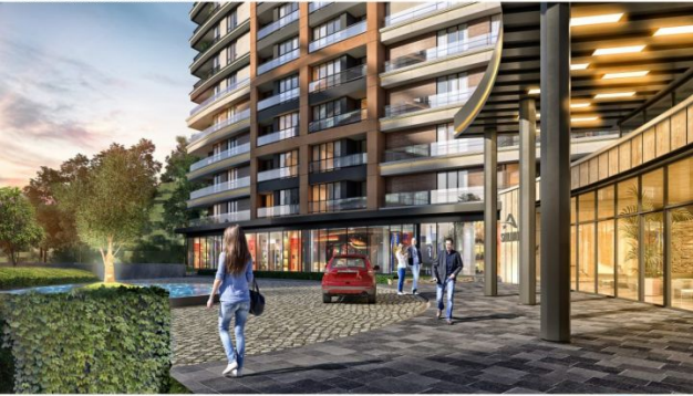
AVRUPA KONUTLARI SAKLIVADI PROJESI