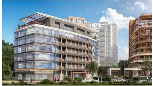
AVRUPA KONUTLARI SAKLIVADI PROJESI